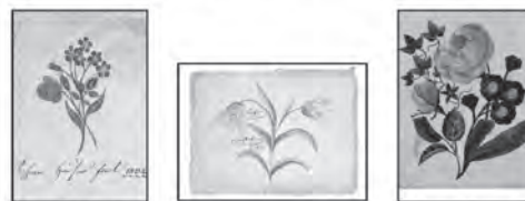
8 Vergißmeinnicht 9 Lilie 10 Rose u. Primeln

Set von 10 Karten im DIN A6-Format: € 7,90 • Set of 10 Postcards $9 / £7 Einzelkarte: € 1,00 (mindestens 5 Karten, auch gemischt) • single cards $1,25 / £1 Portofreie Lieferung ab € 15,00 • Postage free for orders of $18 / £14 or more Bestellungen an / Send me your order: office@karlkoeniginstitute.org