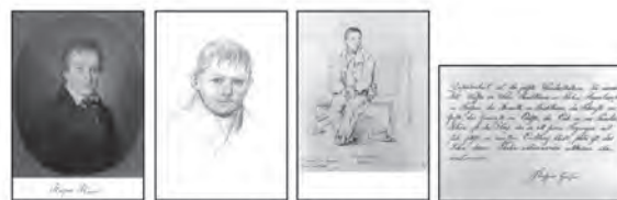
1 Porträt J.F.C. Kreul 2 Kopfstudie Adam 3 Zeichnung K. Hitz 4 Albumblatt

Three portraits of the «Child of Europe», one handwritten verse and six watercolors by Kaspar Hauser