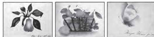
5 Birne 6 Früchtekorb 7 Schmetterling