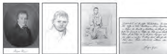
1 Porträt J.F.C. Kreul 2 Kopfstudie Adam 3 Zeichnung K. Hitz 4 Albumblatt

Three portraits of the «Child of Europe», one handwritten verse and six watercolors by Kaspar Hauser