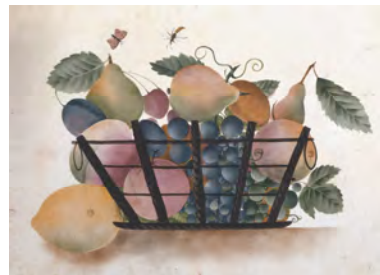
Karte 6 Künstler: Kaspar Hauser