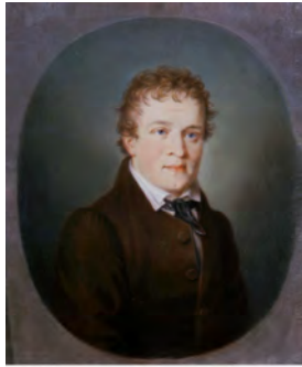
Karte 1 Künstler: J.F.K. Kreul

Davon drei Porträts sowie ein Albumblatt und sechs Aquarelle aus der Hand von Kaspar Hauser. Die Postkarten wurden herausgegeben vom Kaspar Hauser Forschungskreis.