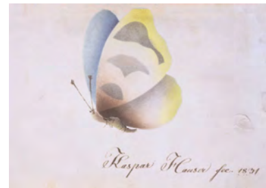
Karte 7 Künstler: Kaspar Hauser