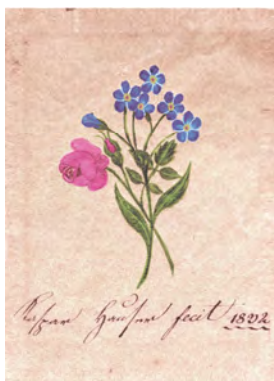
Karte 8 Künstler: Kaspar Hauser