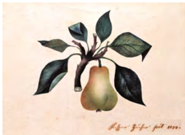
Karte 5 Künstler: Kaspar Hauser