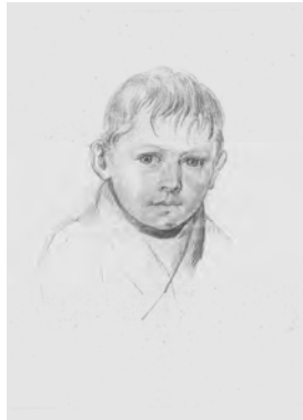
Karte 2 Künstler: Heinrich Adam