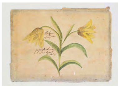
Karte 9 Künstler: Kaspar Hauser