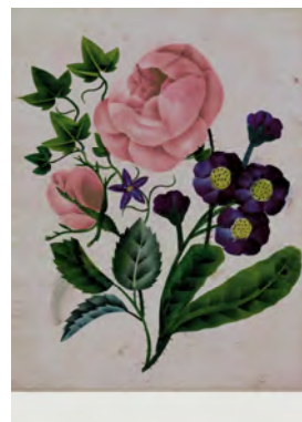
Karte 10 Künstler: K. Hauser

Set, 10 verschiedenen Karten, € 7,90 Einzelkarten (ab 5 Karten je Motiv), € 1,00 je Karte Zuzüglich Versandkosten