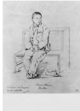
Karte 3 Künstler: Konrad Hitz